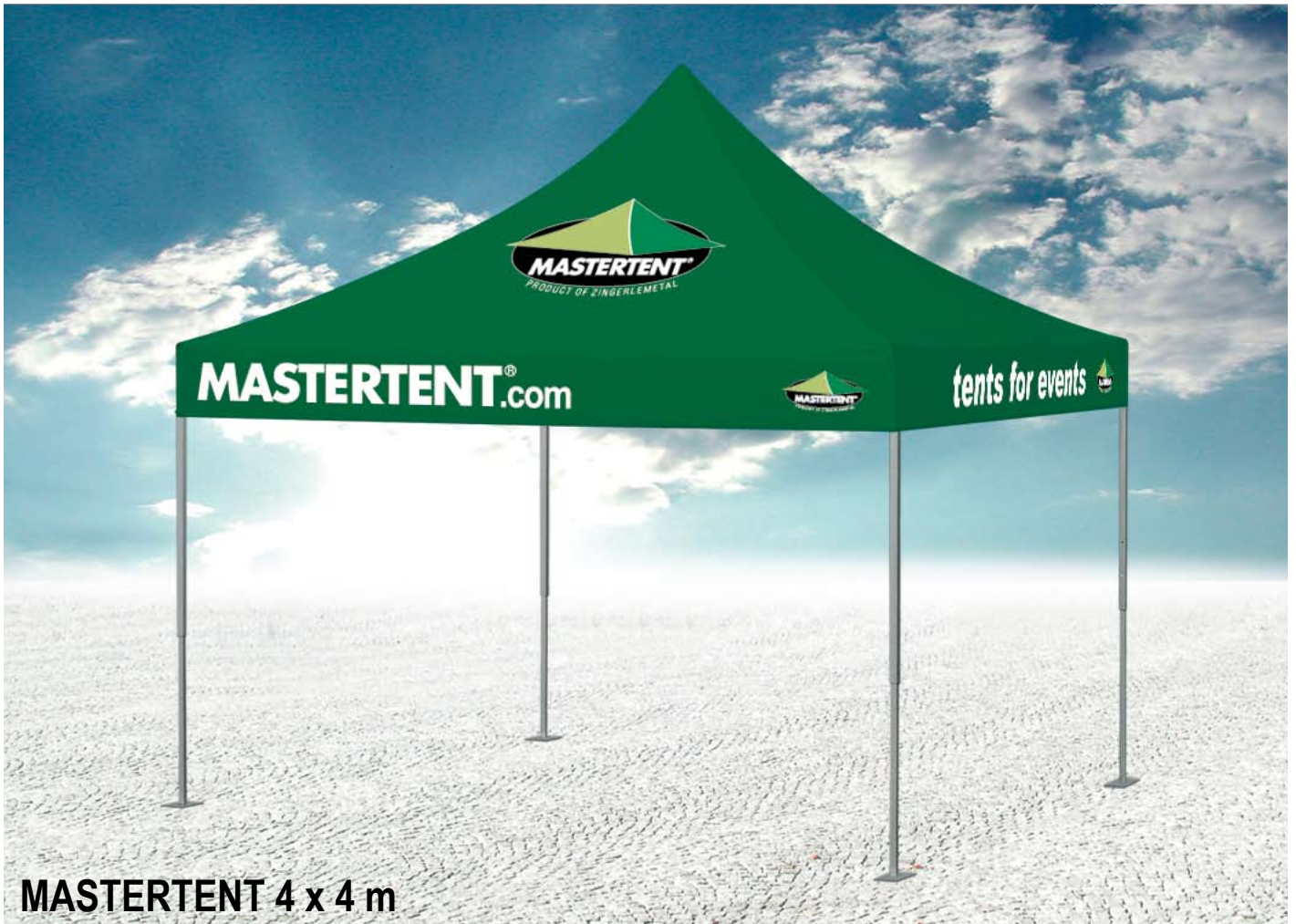
MASTERTENT 4 x 4 m